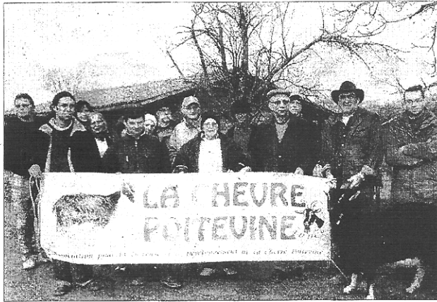
Les congressistes devant la chèvrerie de la Ferme des Vallées.