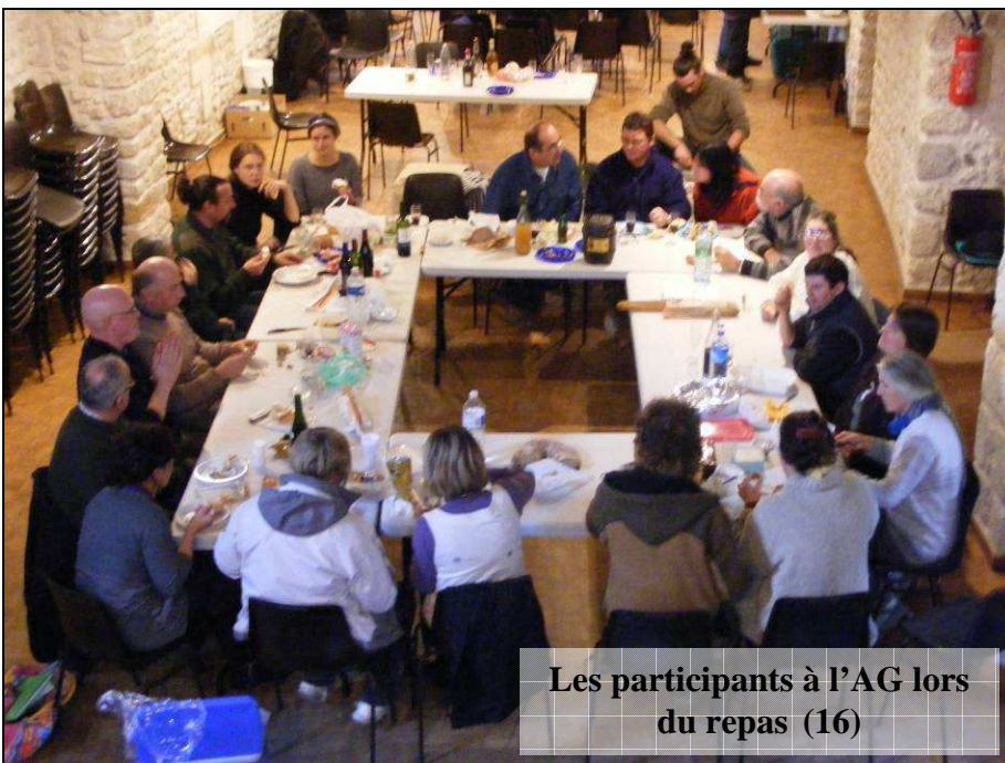
Les participants à l'AG lors du repas (16)

N'hésitez pas à nous envoyer vos photos pour en faire profiter tout le monde !