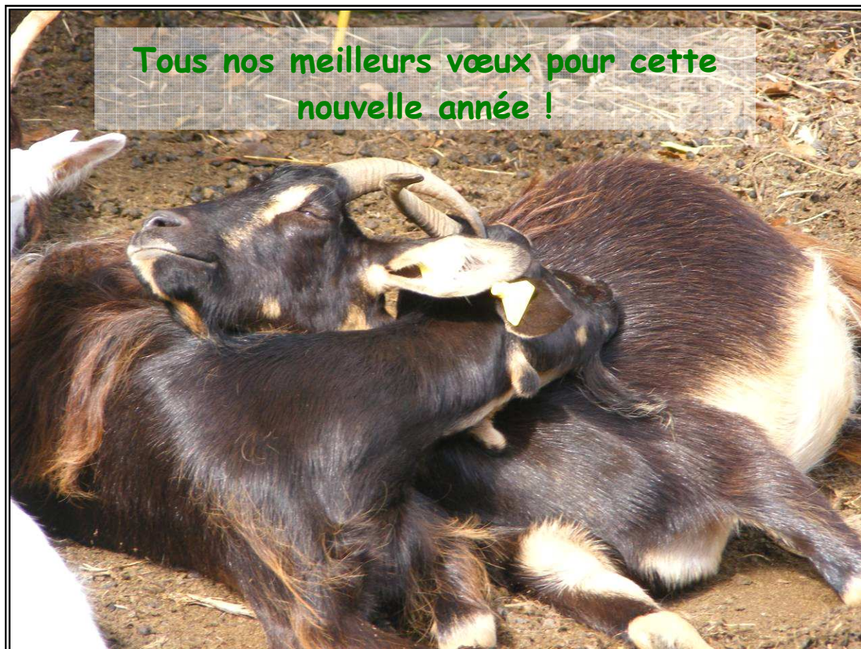
Chèvres de Christophe Briand (22)

Rédacteur : Clément Vinatier Roché 2, rue du Port Brouillac 79510 COULON (05.49.79.19.25)