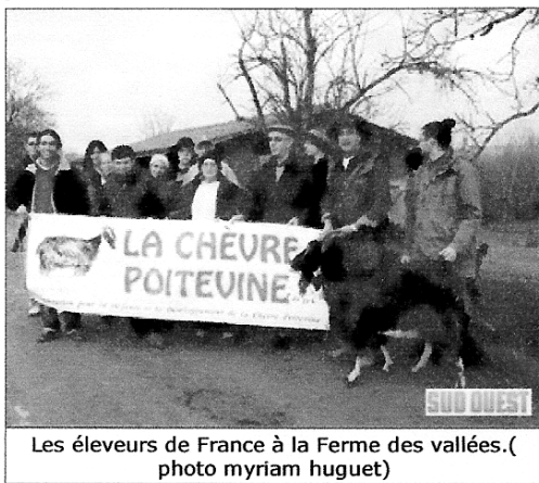
Les éleveurs de France à la Ferme des vallées.

Article extrait du quotidien Sud Ouest, de décembre 2009.