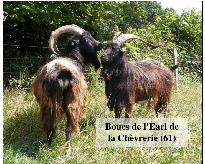
Boucs de l'Earl de la Chèvrerie (61)